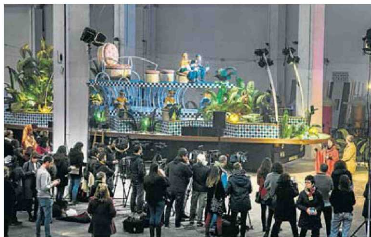
Ahir Barcelona va presentar les carrosses per a la Cavalcada d'aquest any.

A Lleida unes 600 persones acompanyaran les 14 carrosses -que repartiran tres tones de caramels aptes per a celiacs- i el bus turístic -que projectarà les fotos que aquests dies els més petits s'han fet al Parc de Nadal del Cucalòcum-. Precediran la comitiva els gegants i el Marraco, el tradicional drac de més de vuit metres de llarg a qui els més petits donen el xumet quan el deixen.